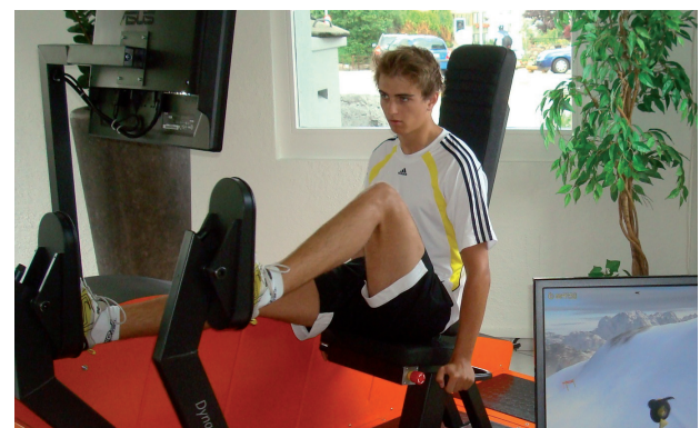
Am eigenen Körper austesten - im Showroom in Schindellegi

Dynamic Leg Press - bringt Dynamik in jedes Kraft- und Rehabilitationstraining!